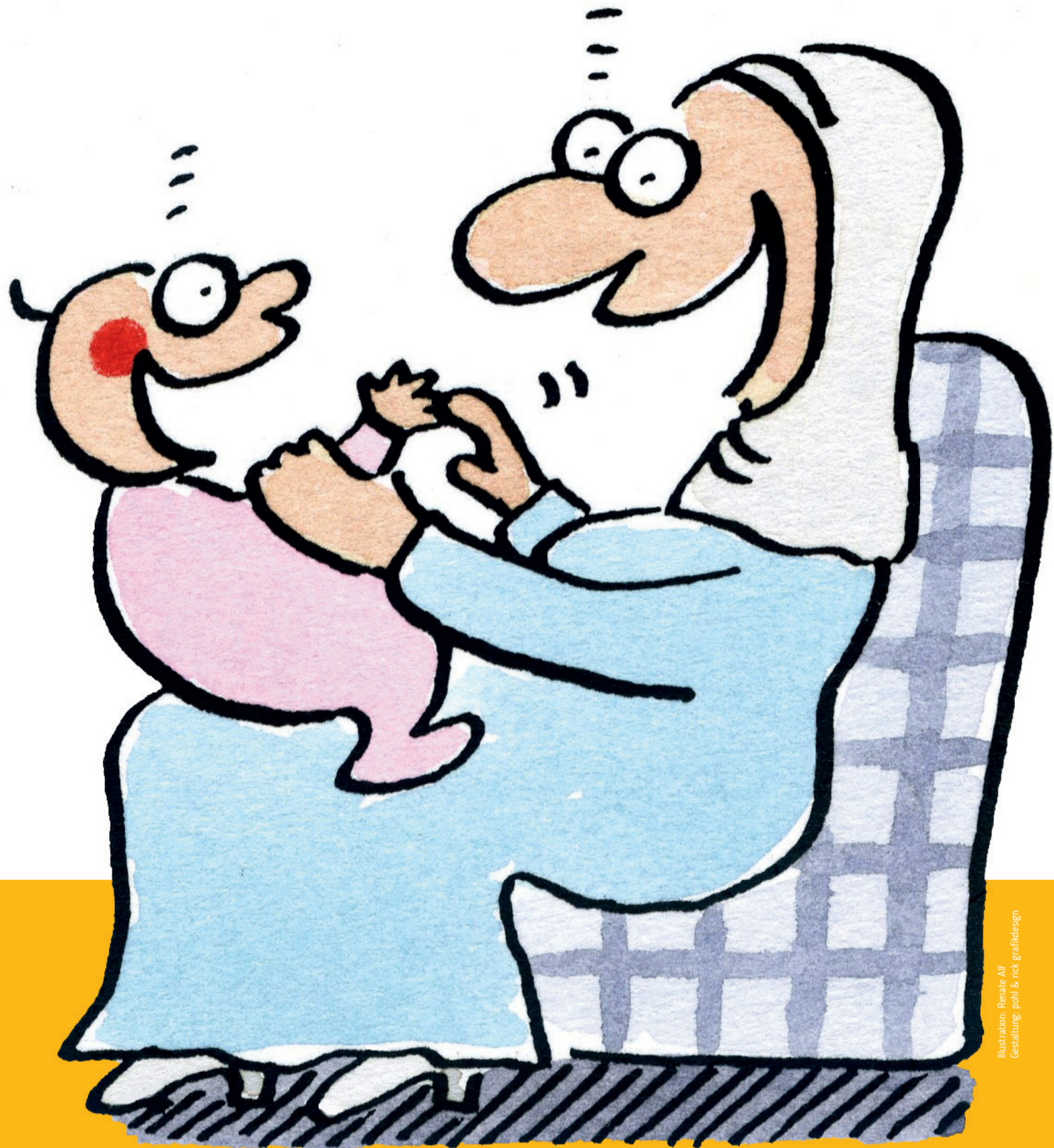
Illustration: Renate Alf Gestaltung: pohl & rick grafikdesign