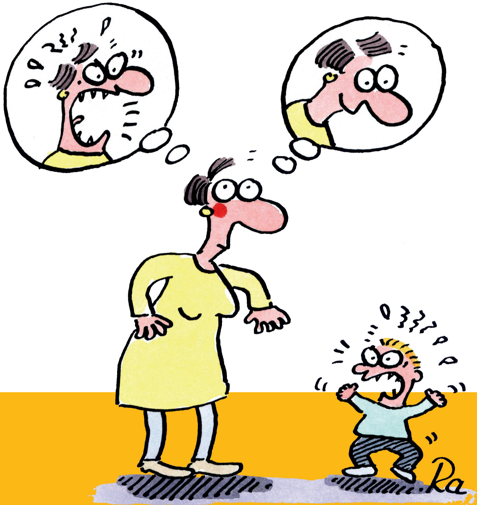
Illustration: Renate Alf Gestaltung: pohl & rick grafikdesign